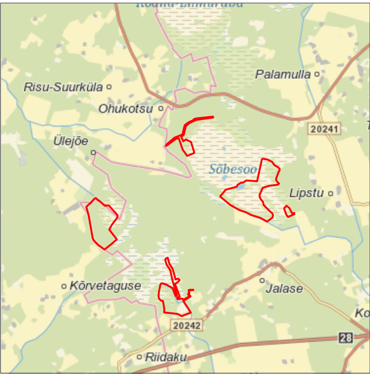
Kaardileht nr 631 Rapla